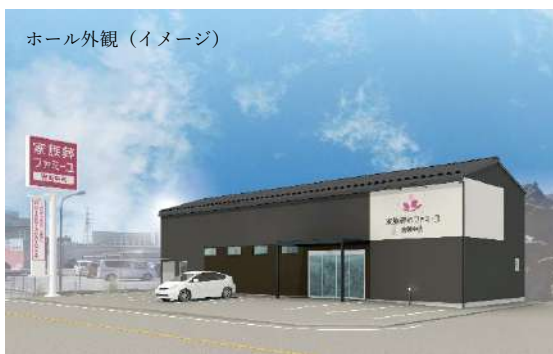
ホール外観（イメージ） 安城市の中心部に初出店。1日1組の貸切で、プライベートな時間を大切な方とゆっくりとお過ごしいただけます

家族葬のファミリーは、「お葬式を家族のものに。」をコンセプトとした「1日1組・完全貸切」の家族葬ブランドです。愛知県では 2004（平成 16）年から直営展開をスタートし、現在知多・三河エリアに 15 ホールを運営しています。