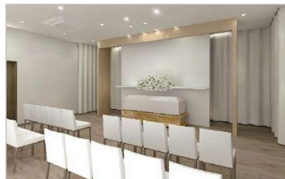
ご家族のご要望に対応しやすいシンプルな式場（イメージ）

「家族葬」とは、故人の家族や親族、親しかった友人などと比較的少人数で営まれるプライベートを重視したお葬式です。いまや全国的にスタンダードとなった家族葬は、2000（平成 12）年に宮崎県にオープンした「ファミリー大塚ホール」がルーツです。翌年には名称を「家族葬のファミリー 大塚ホール」と変更しましたが、これが家族葬を初めてブランド化した例とされています。